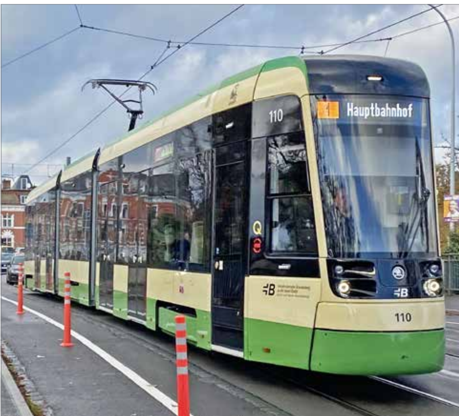
Platz ist knapp in der Brandenburger Altstadt, so dass sogar die Brückenrampen kurz und steil ausfallen müssen. Wie gut, dass nicht mehr die Autoströme diese Engstellen passieren müssen.