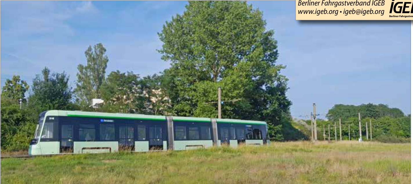
Nach dem großflächigen Abriss von Wohnhäusern macht Neuberesinchen einen recht naturnahen Eindruck, schade für das Massentransportmittel Straßenbahn. Aber der hier befindliche Betriebshof sichert die Strecke dauerhaft.