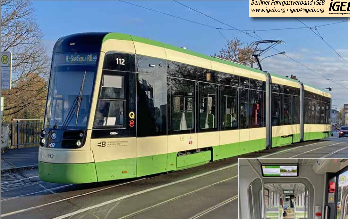
oben: Die Lackierung der Verkehrsbetriebe Brandenburg an der Havel (VBB) ist interessanter als die in Frankfurt/Oder, mit dem Beige als Hauptfarbe, aber trotzdem klassisch.