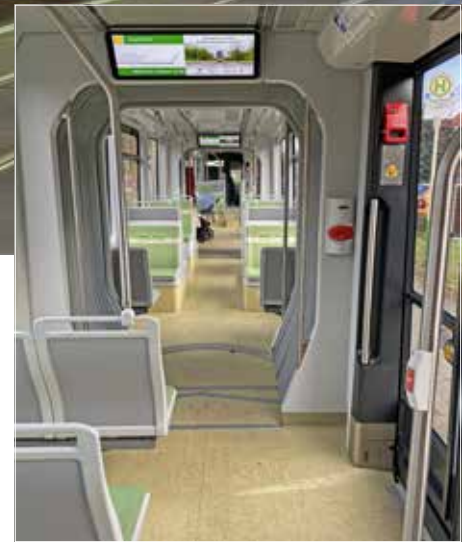
rechts: Die Wagenübergänge kommen ohne Stufen und Rampen aus. Der breite Durchgang macht einen großzügigen Eindruck.