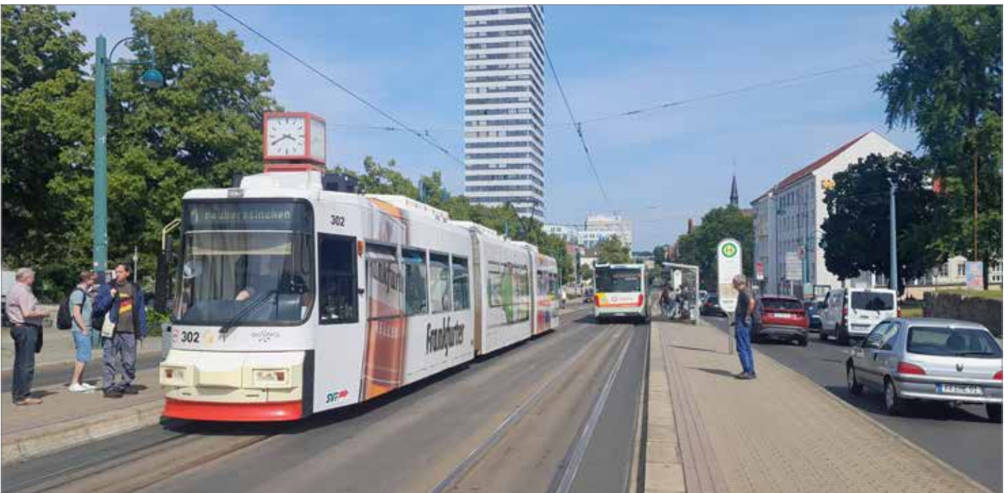
oben: GT6, die erste Niederflrbahn in der Oderstadt. Auch diese Wagen stammen aus einer Sammelbestellung, damals mit dem sächsischen Zwickau. Leider wird die schöne Lackierung in creme-rot bei diesem Typ oft durch Ganzreklame verdeckt.