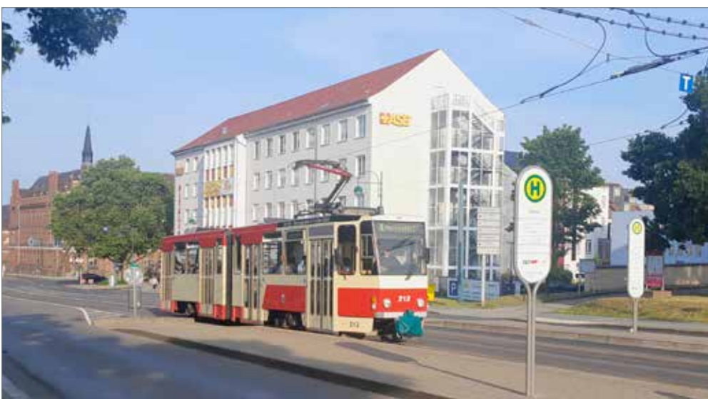
links: Diese Wagen haben nun ausgedient: Tatra KT4D, eigens für die DDR entwickelt und dann im gesamten Ostblock erfolgreich. Nur in Frankfurt an der Oder waren sie bis zuletzt in der Originalversion zu erleben, ohne Niederflurmittleteil und mit der historischen Beschleunigersteuerung.